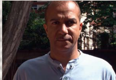
Pascal Légitimus, comédien