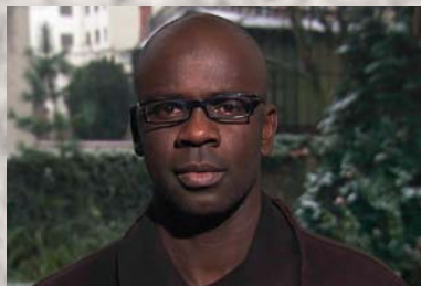
Lilian Thuram, ancien international de football