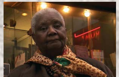
Yandé Christiane Diop, directrice des éditions Présence africaine