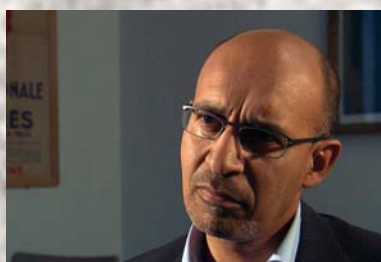
Harlem Désir, secrétaire national à la coordination du Parti socialiste