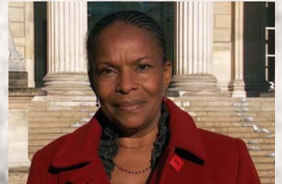
Christiane Taubira, députée de Guyane