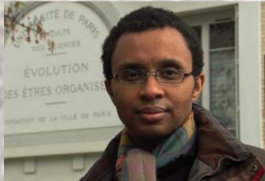
Pap Ndiaye, historien