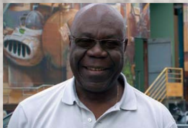
Manu Dibango, musicien